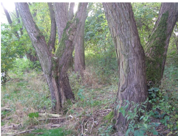
Lokalita Pod Zbábou před vichřicí