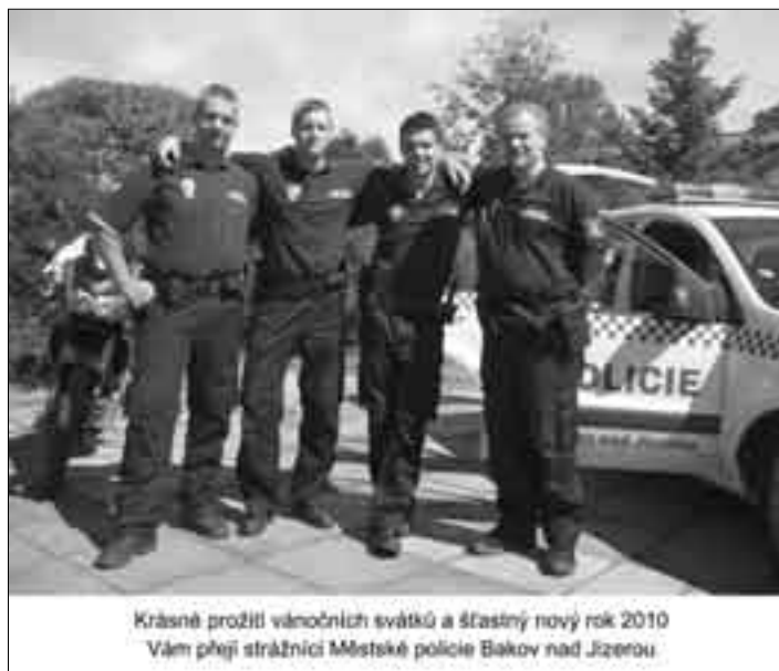
Krásně prožili vánočních svátků a šťastný nový rok 2010 Vám přeji strážníci Městské policie Bakov nad Jizerou