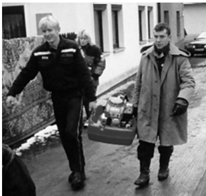
ilustrační foto z roku 2000

Tím končí práce povodňové komise, ale nekončí práce členů SDH. Ti již od rána čerpají na požádání občanů vodu z vytopených sklepů.