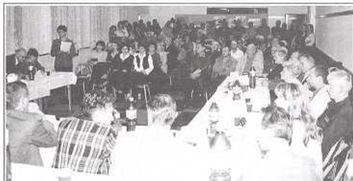
Pohled do sálu při jednání zastupitelstva 15. listopadu 2002

Při volbě se mnohokrát ze strany návštěvníků ozvalo nesouhlasné