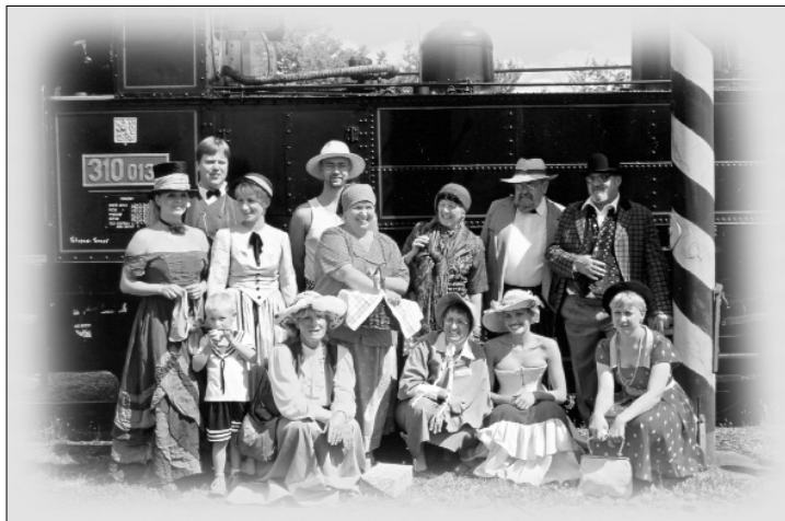
Jízda historickým vlakem v srpnu 2003