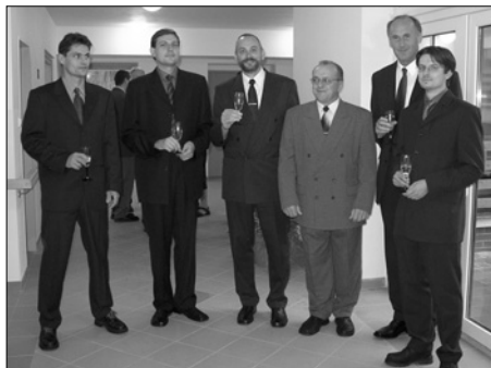
Zástupci města, projektové kanceláře Profes Turnov a stavební spol. BAK Trutnov

Začátkem měsíce května 2002 byla po provedeném výběrovém řízení zahájena výstavba Domu s pečovatelskou službou (DPS) v Bakově nad Jizerou. Dům byl přistavěn k objektu bývalých jeslí