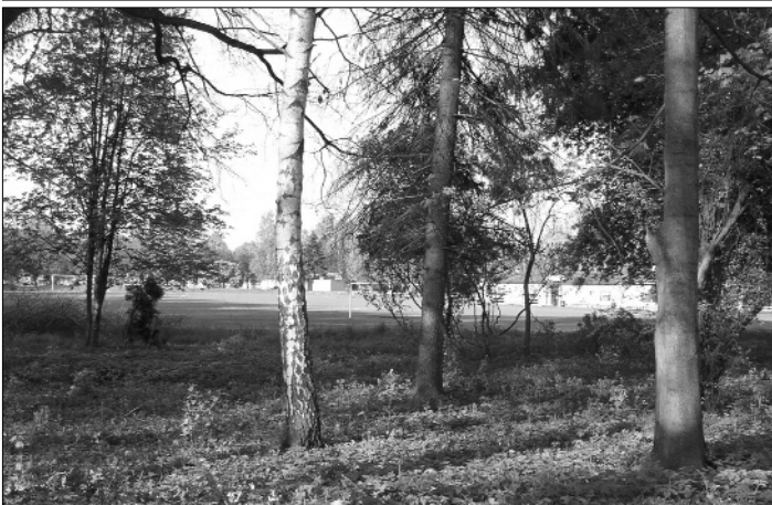
Úklid Pod Stráněmi.