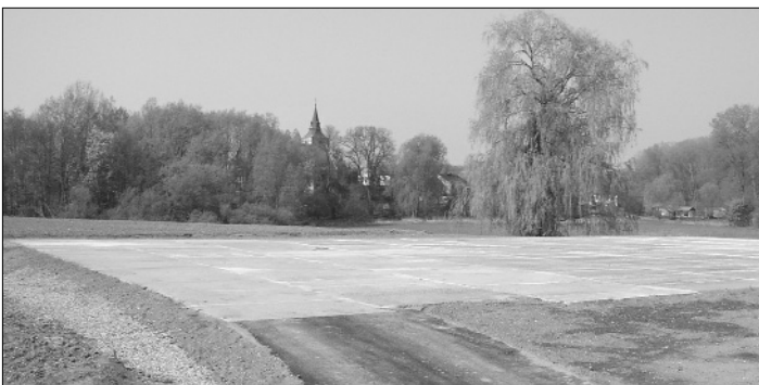
1. etapa rekultivace "Pod Vápeníkovými" dokončena.