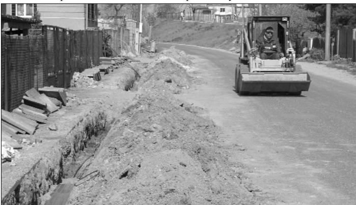
Horka - výměna veřejného osvětlení.