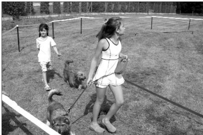
ze soutěže „Voříšek roku 2003“

Loni se poprvé uskutečnilo posvícenské odpoledne na kynologickém cvičišti , a tak se organizátoři rozhodli jej zopakovat i letos. Museli si však z organizačních důvodů posunout termín již na sobotu 21.8. Od 13.30 hodin bude otevřen stánek s občerstvením - alko i nealko, kuřata, klobásy a jiné dobroty a k tomu bude hrát reprodukováná hudba. Od 14. hodin se děti mohou se svými psími miláčky (pouze rasa Voříšek) zúčastnit výstavy, kde mohou předvést, co jejich pejsek umí, jak je poslouchá. Vítěz získá titul " Voříšek Bakova 2004 ". Soutěží-