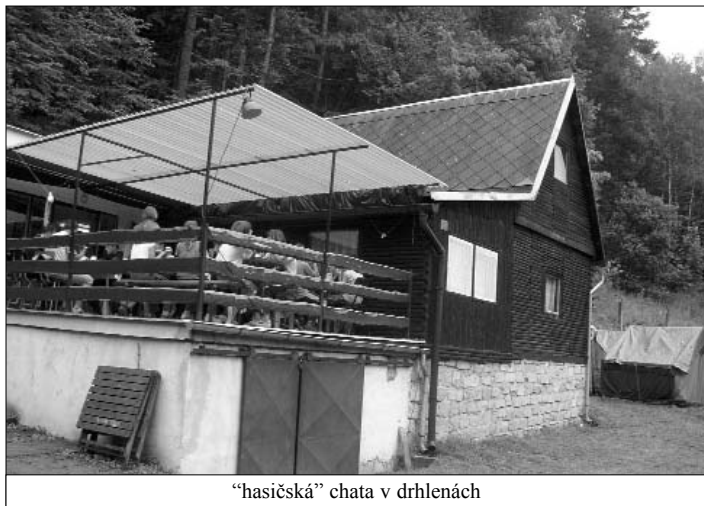
"hasičská" chata v drhlenách