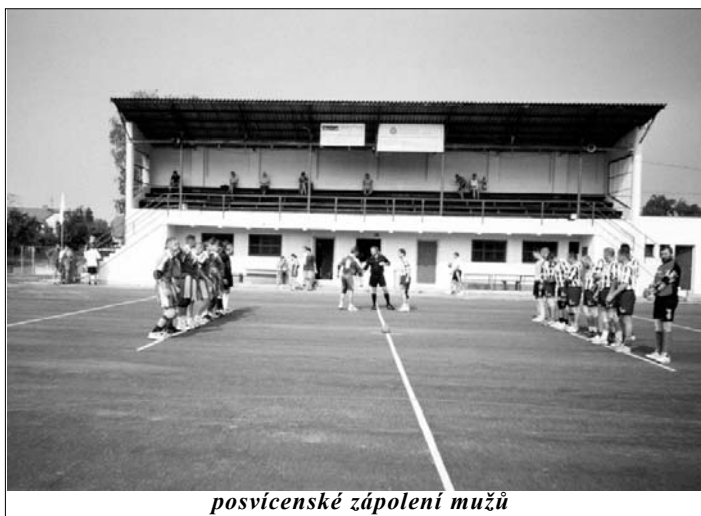
posvícenské zápolení mužů