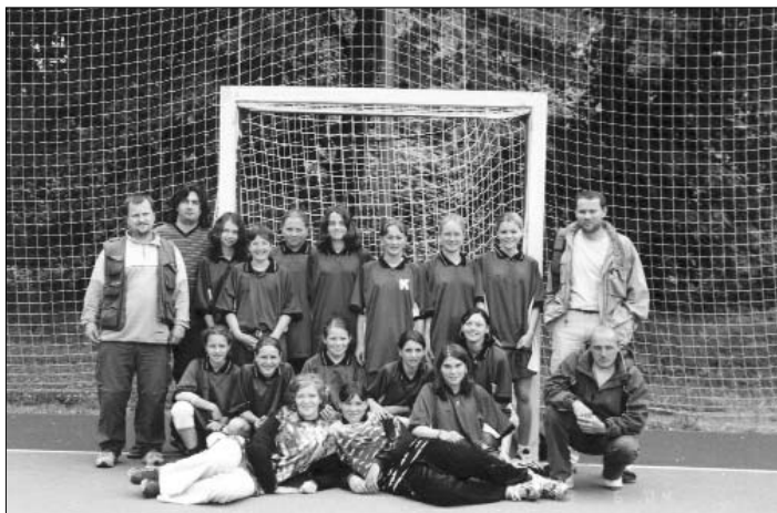
družstvo starších zákyň