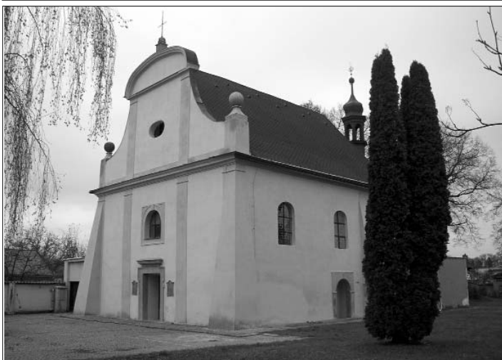
Kostel sv. Barbory v novém.