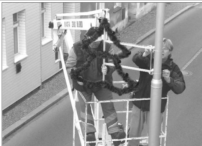
Instalce nového vánočního osvětlení.