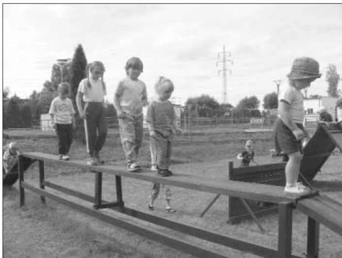
Kynologické cvičiště bylo na posvícenskou sobotu plné soutěžících dětí.