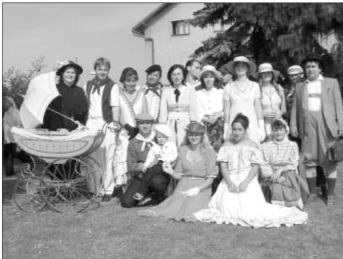
Furianti jako z dob Rakousko-Uherska