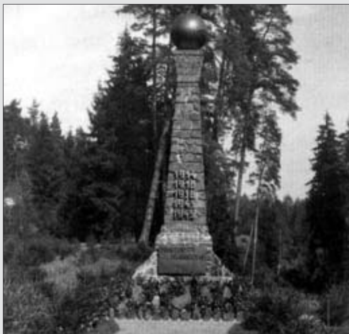
Původní vzhled krátce po stavbě