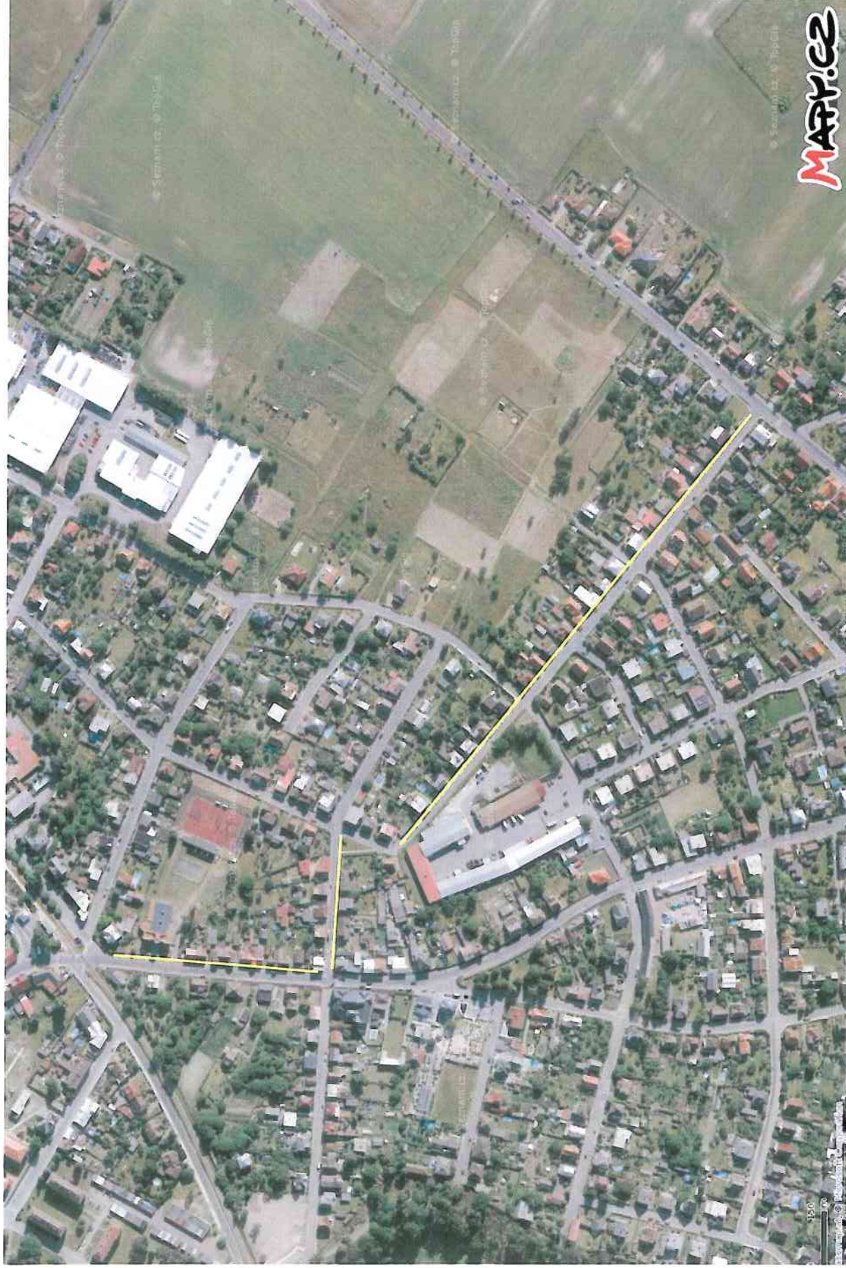
Príloha č. 2 k zápisu z jednání Bezpečnostní komise ze dne 26.1.2017 zóny zákazů stání + ulice Žižkova (vnitřní strana zakroucení zatáčky)