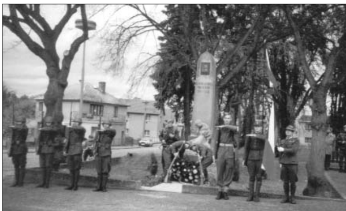
Ilustrační foto: Pomník padlým, Komenského sady 28.10.1998 .