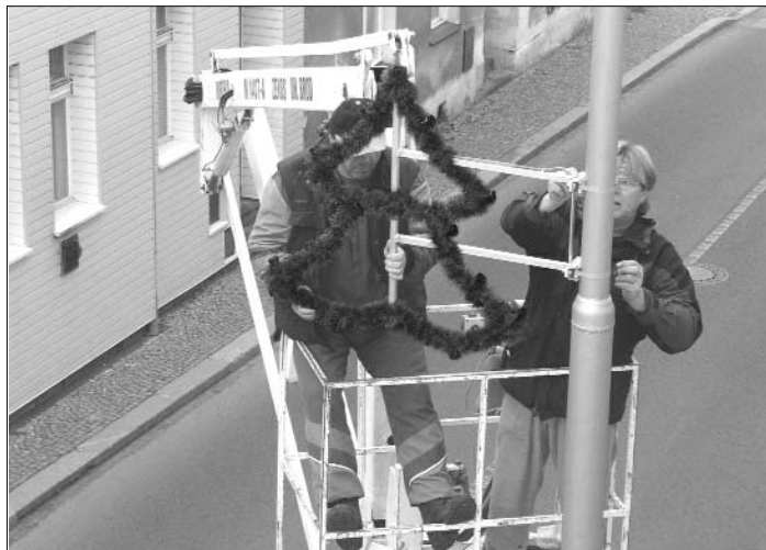
Instalce nového vánočního osvětlení.