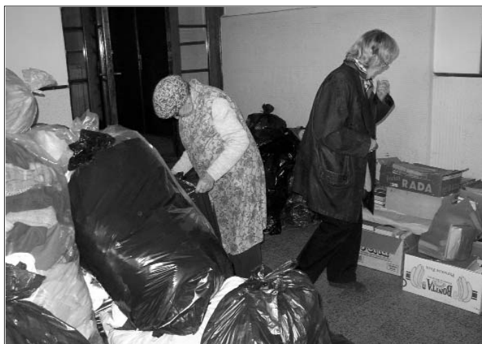
Humanitární sbírka pro Diakonii Broumov byla opět úspěšná.