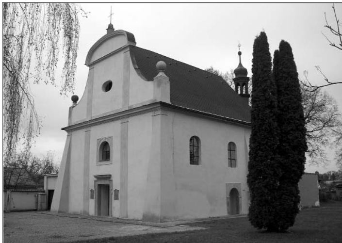
Kostel sv. Barbory v novém.