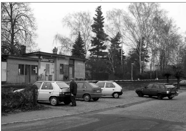
Nové parkoviště v Tyršově ulici.