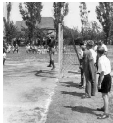
z válečné bakovské házené