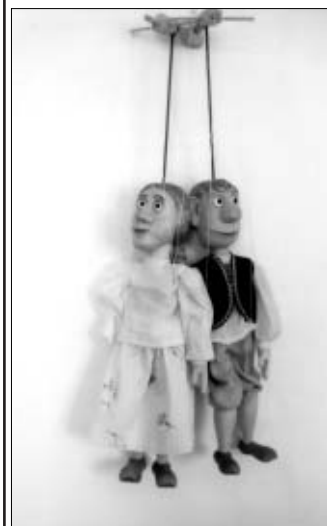
z výstavy loutek ...