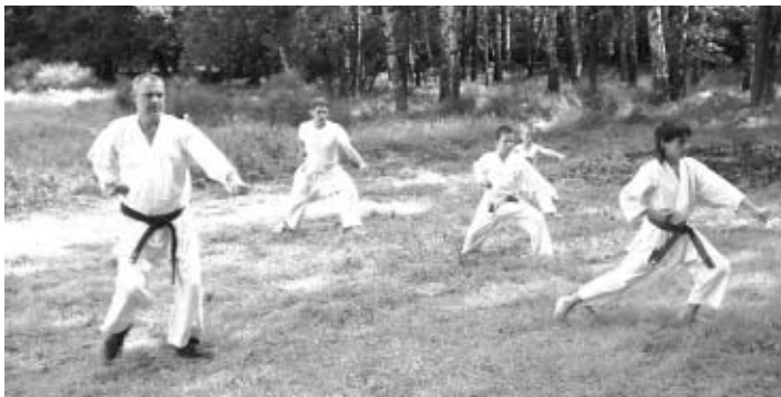
Autoři článku jsou trenéři Karate Kobu Bakov nad Jizerou a Karate Kobu MB. www.karatekobu.com

Tradicí rodiny Motobu zlomil až Chokiho bratr Choyu Motobu, který vyškolil bojovníka Seikichi Ueharu. Ten pak na základě tohoto bojového umění vytvořil vlastní styl, který s úctyhodnou skromností nenazval jménem svým, nýbrž jménem rodiny Motobu. Toto umění přetrvalo dodnes.